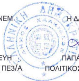
ΠΑΠΑΝΕΣΤΗ ΔΑΦΝΗ ΠΟΛΙΤΙΚΟΣ ΜΗΧΑΝΙΚΟΣ ΠΕ3/Α