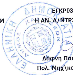
Δάφνη Παπανέστη Πολ. Μηχ\κος ΠΕ3/Α'