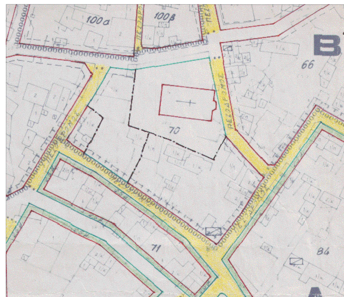
ΑΠΟΣΠΑΣΜΑ ΡΥΜΟΤΟΜΙΚΟΥ ΚΑΙΜ. 1 : 1000