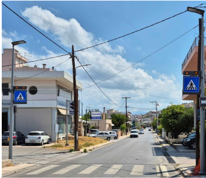
Επί της οδού Ληλαντίων στο ύψος της οδού Ρεθύμνου