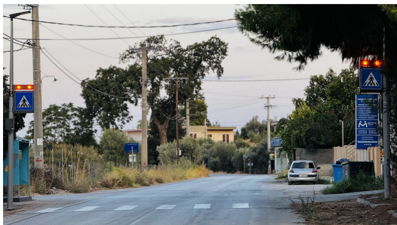
Επί της οδού Δημάρχου Σκούρα στο ύψος της οδού Γ. Οικονομίδη προς το 23 ο Δημοτικό Σχολείο