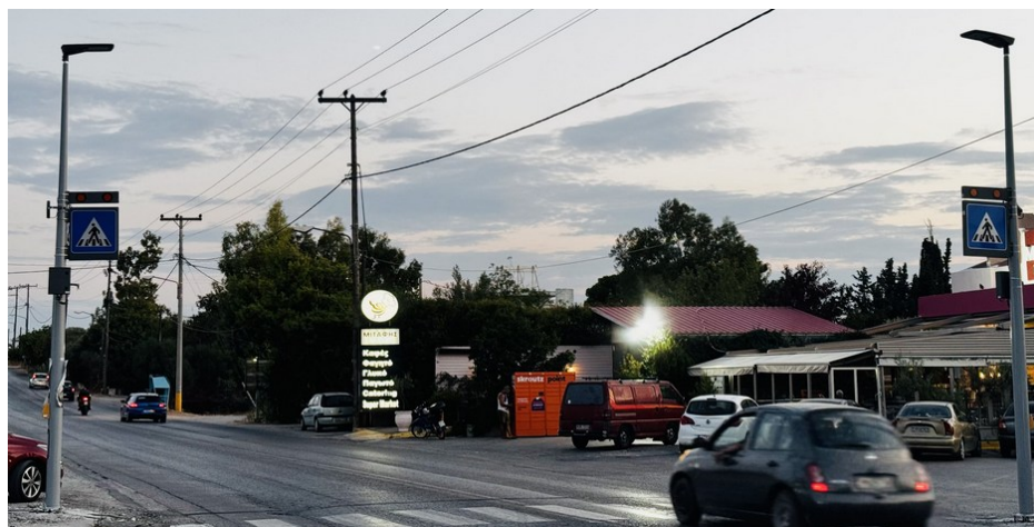
Επί της Εθνικής Αντιστάσεως στη Νέα Αρτάκη στο ύψος του φούρνου ΜΙΤΑΦΗ