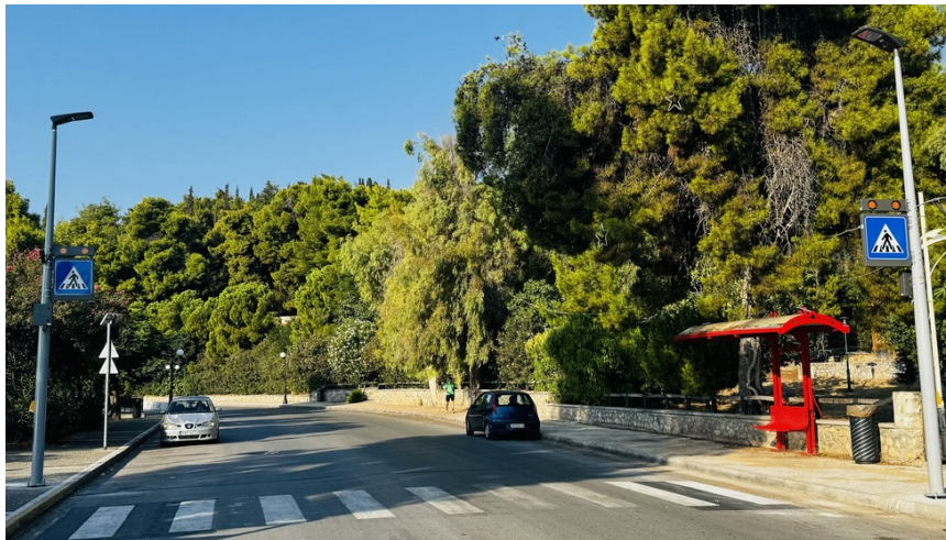
Επί της Λεωφ. Μακαρίου στο ύψος της οδού Αριστοτέλους