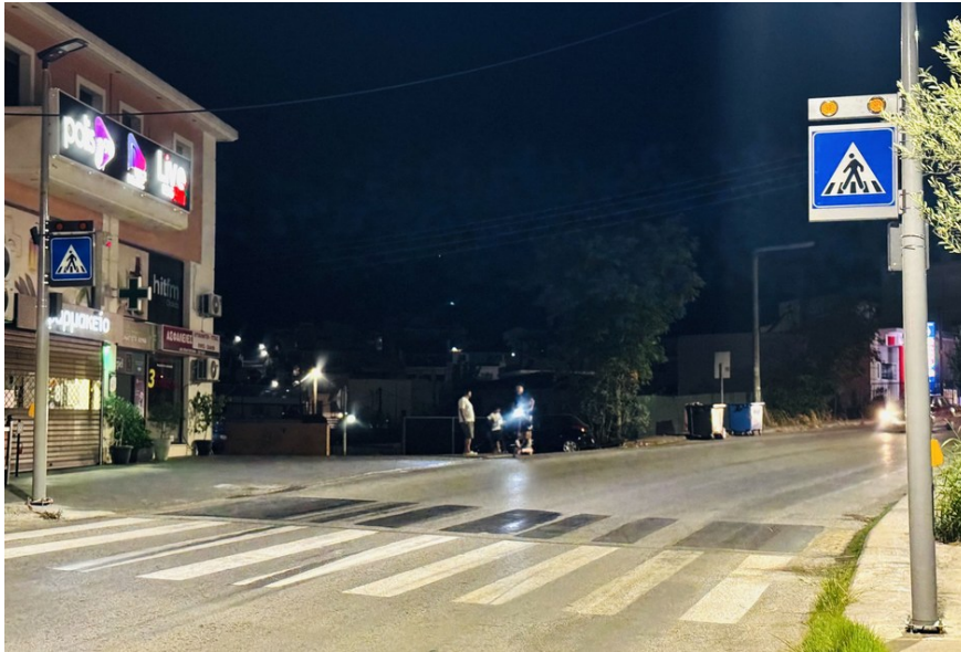
Επί της Λεωφόρου Κ. Καραμανλή στο ύψος της οδού Πιπίνου