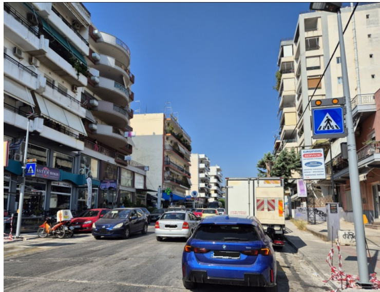
Επί της Λ. Χαϊνά στο ύψος του Δημόκριτου