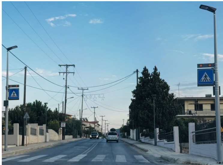
Επί της Λεωφόρου Δροσιάς στην είσοδο της Δροσιάς