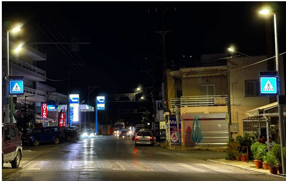
Επί της οδού Οσίου Ιωάννη Ρώσου στο ύψος της Αγ. Γεωργίου – πιάτσα ταξί στο Βασιλικό