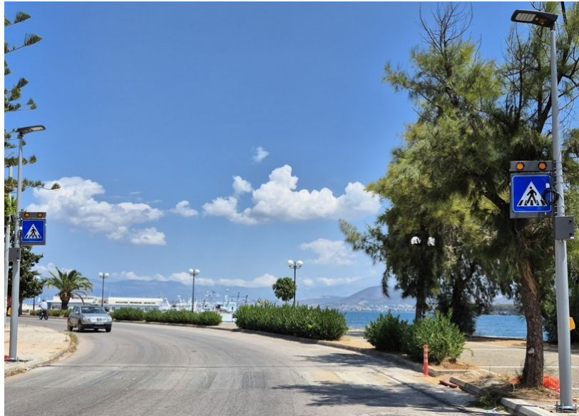
Επί της της Λεωφ. Μακαρίου στο ύψος της παιδικής χαράς