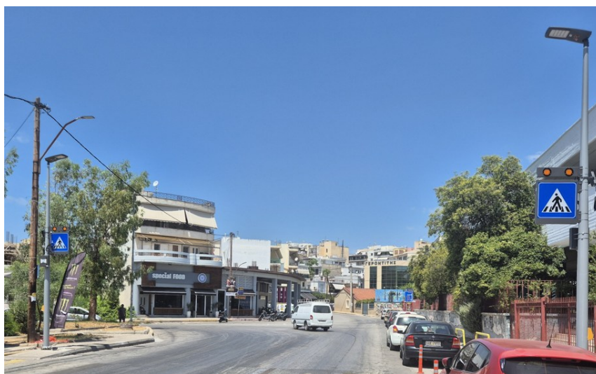
Επί της Ν. Καραγιάννη στο ύψος του ΕΠΑ.Λ.