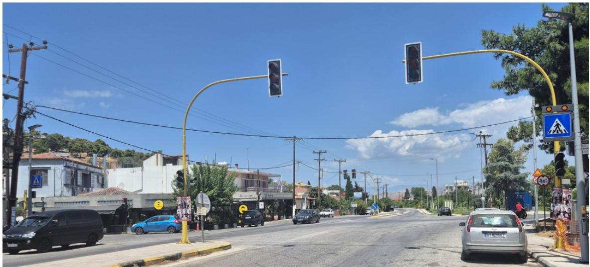
Στην είσοδο του Βαθέως πριν τις σιδηροδρομικές γραμμές στη ΔΕ Αυλίδας