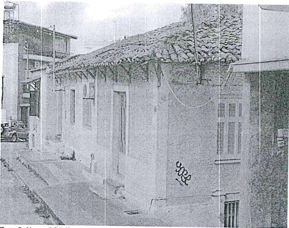
Εικ. 3 (έτος 2024)