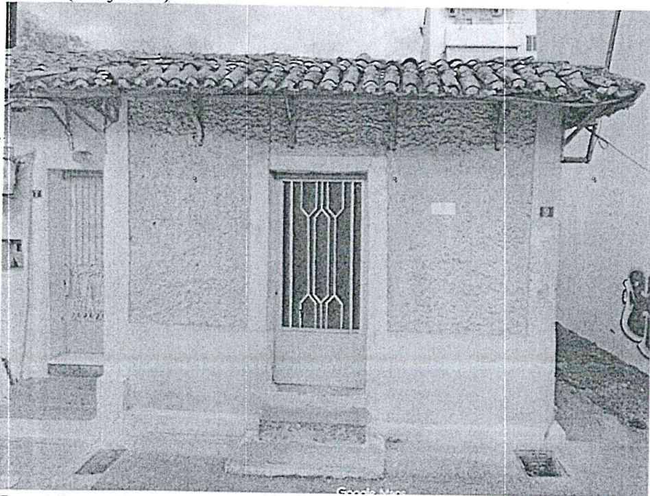
Εικ. 4 (έτος 2024)